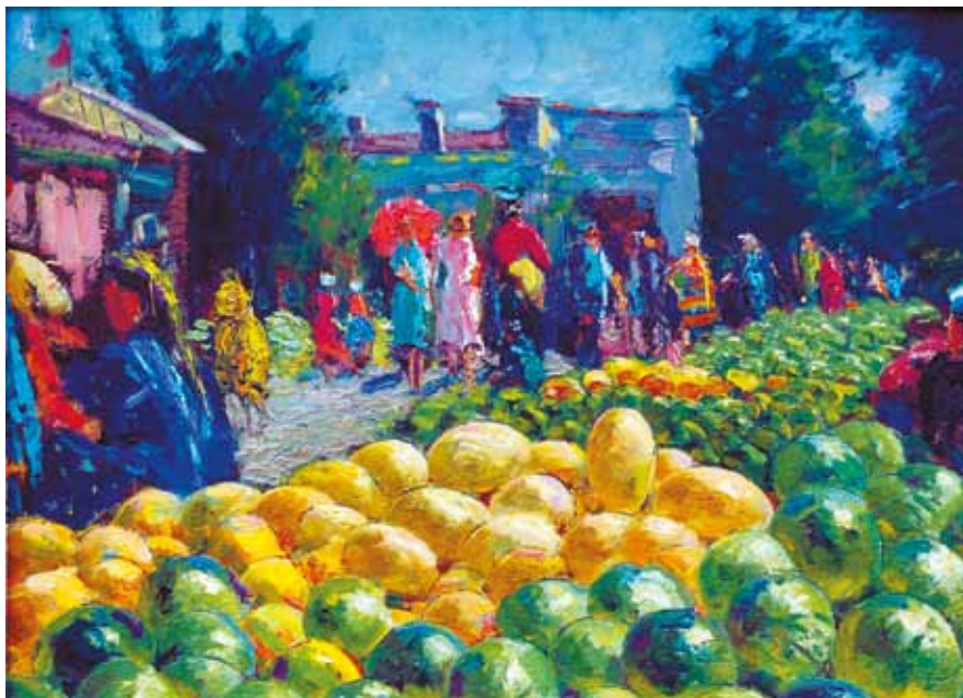
Леонид Брюмер. Джамбульский базар. Картон, масло. 27х36. 1962.