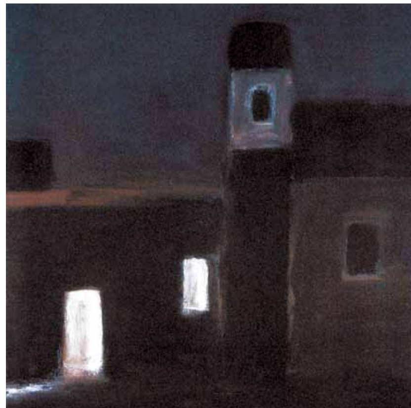
Петр Дик. Ночной город. Наждачная бумага, пастель, уголь. 30x30.1992.

Из письма Бориса Пастернака своей жене Зинаиде Николаевне Нейгауз-Пастернак от 12 сентября 1941 г.