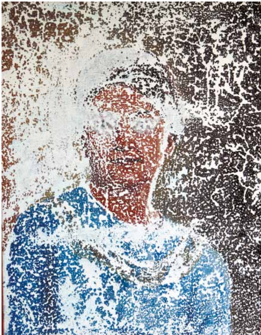
Эдуард Горонович. Память. Холст, масло. 55x40.2001.