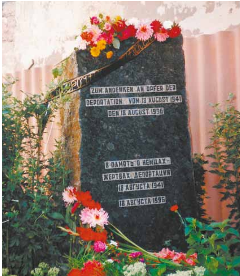
Памятный знак жертвам депортации. Установлен в Симферополе у лютеранской кирхи.